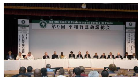
第 9 届和平市长会议总会 2017 年 8 月长崎市